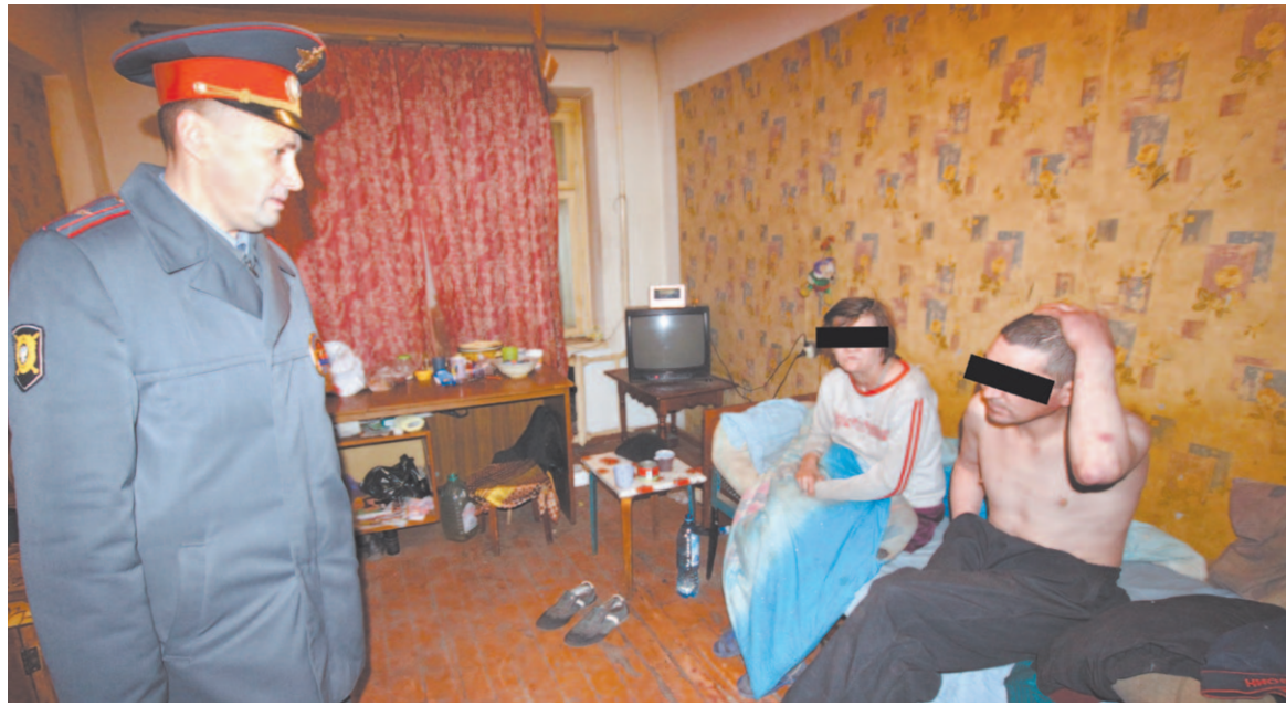
НА ДНЕ. РАБОТА УЧАСТКОВОГО СВЯЗАНА С ПОСТОЯННЫМ ОБЩЕНИЕМ С «АСОЦИАЛЬНЫМИ» ЛЮДЬМИ

– Семнадцать лет. Я по Коми самый старый участковый. Люди столько не работают. Район, конечно, сложный. И глухой. И протяженный.